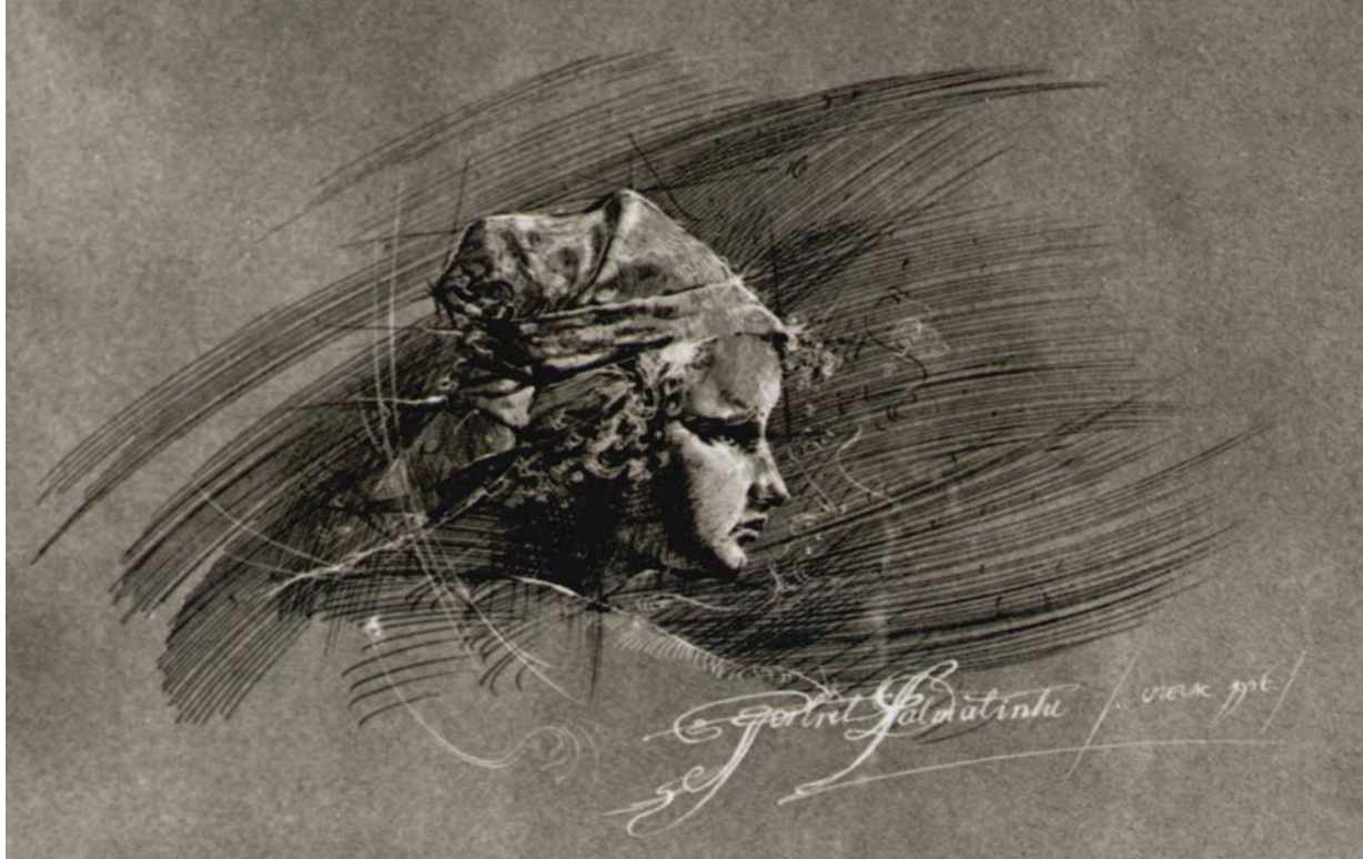
— Портрет Далматинке (1976), туш, темпера на папиру —