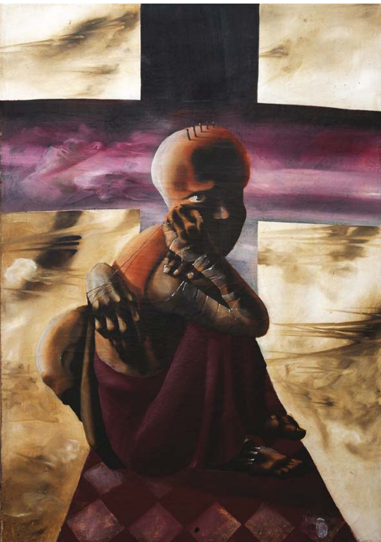
Без назива (1972), уље на платну