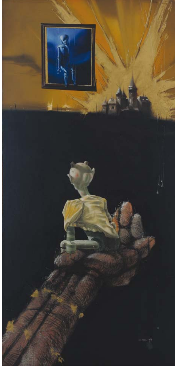
Рано слослутна зрелост-бацил и инбецил (1974), уље на платну

Сећајући се са пијететом чувеног новосадског сликара и графичара Милана Миће Узелца (1950-2008) приредили смо изложбу његових дела која се чувају у фонду Завичајне галерије Музеја града Новог Сада.