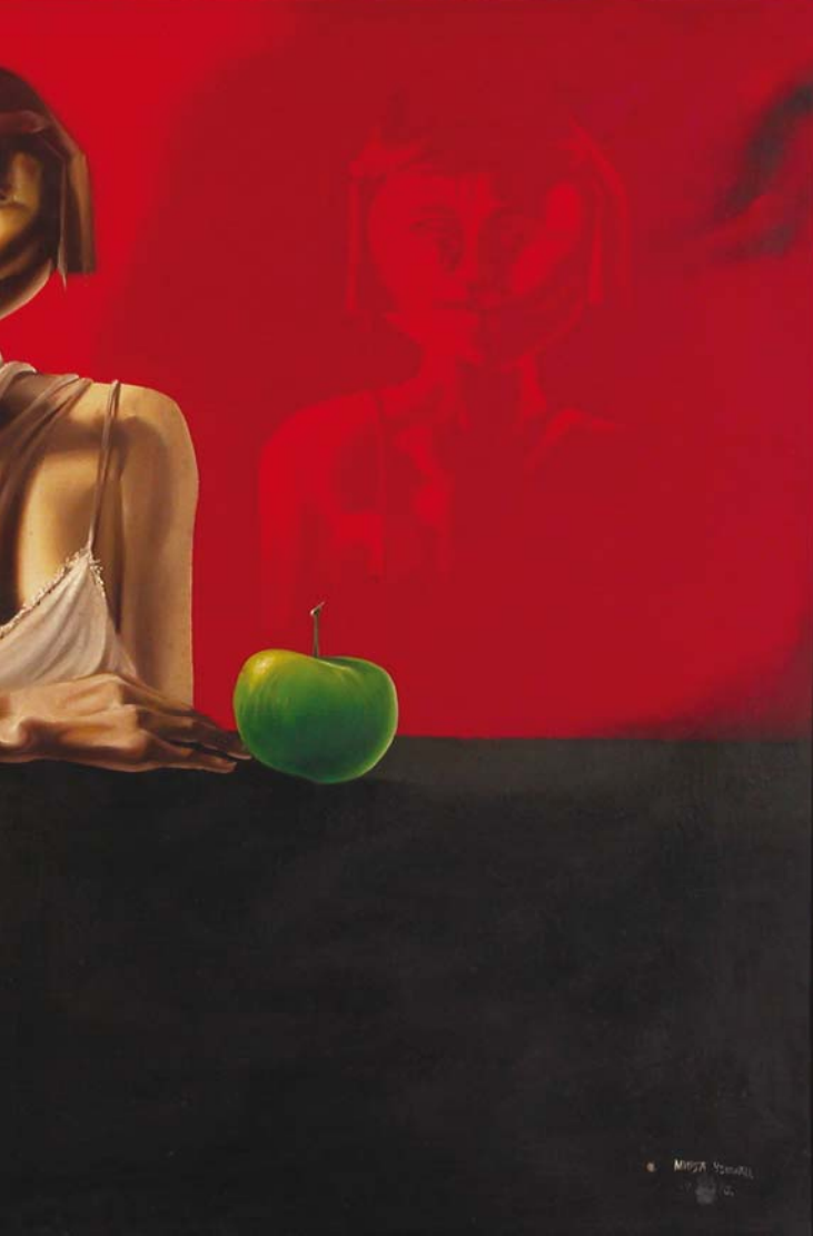
Дамино летње поподне или држ`те лопова (1973), уље на платну